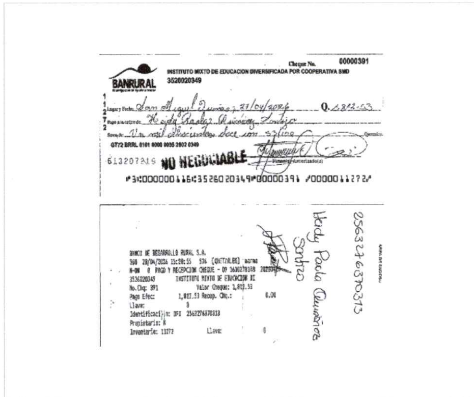
Imagen de cheque

Fecha: 29/04/2026 Monto: Q 1,812.53 Cuenta: XXXXX0349-Monetario-INSTITUTO MIXTO DE EDUCACION DIVERSIFICADA POR COOPERATIVA SMD-GTQ Número de Cheque: 391